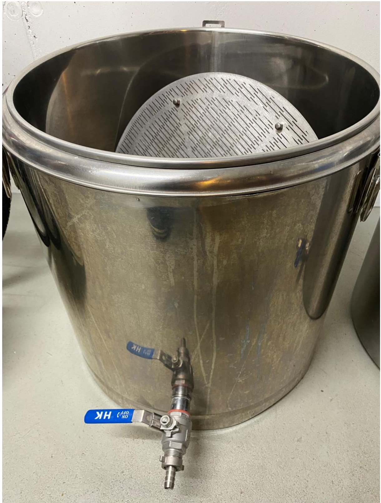
Thermoport 70 Liter inkl. Läuterboden